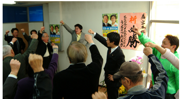
2007年2月11日に行なわれた事務所開きの様子